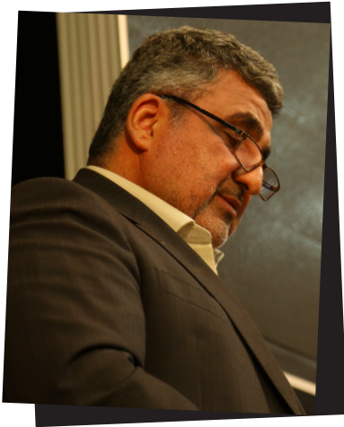
جناب آقای مهدی فرجی جانشین وزیر دفاع و پشتیبانی نیروهای مسلح