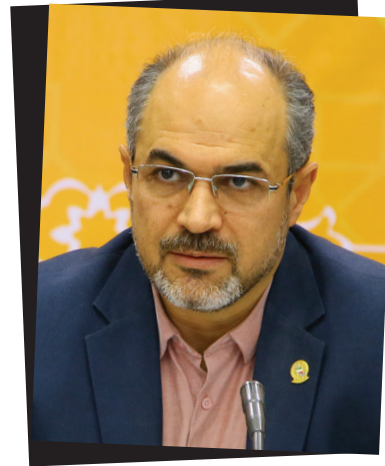
جناب آقای مجید فخری رئیس سازمان جغرافیایی نیروهای مسلح و رئیس شورای سیاستگذاری نمایشگاه بین المللی ایران ژئو